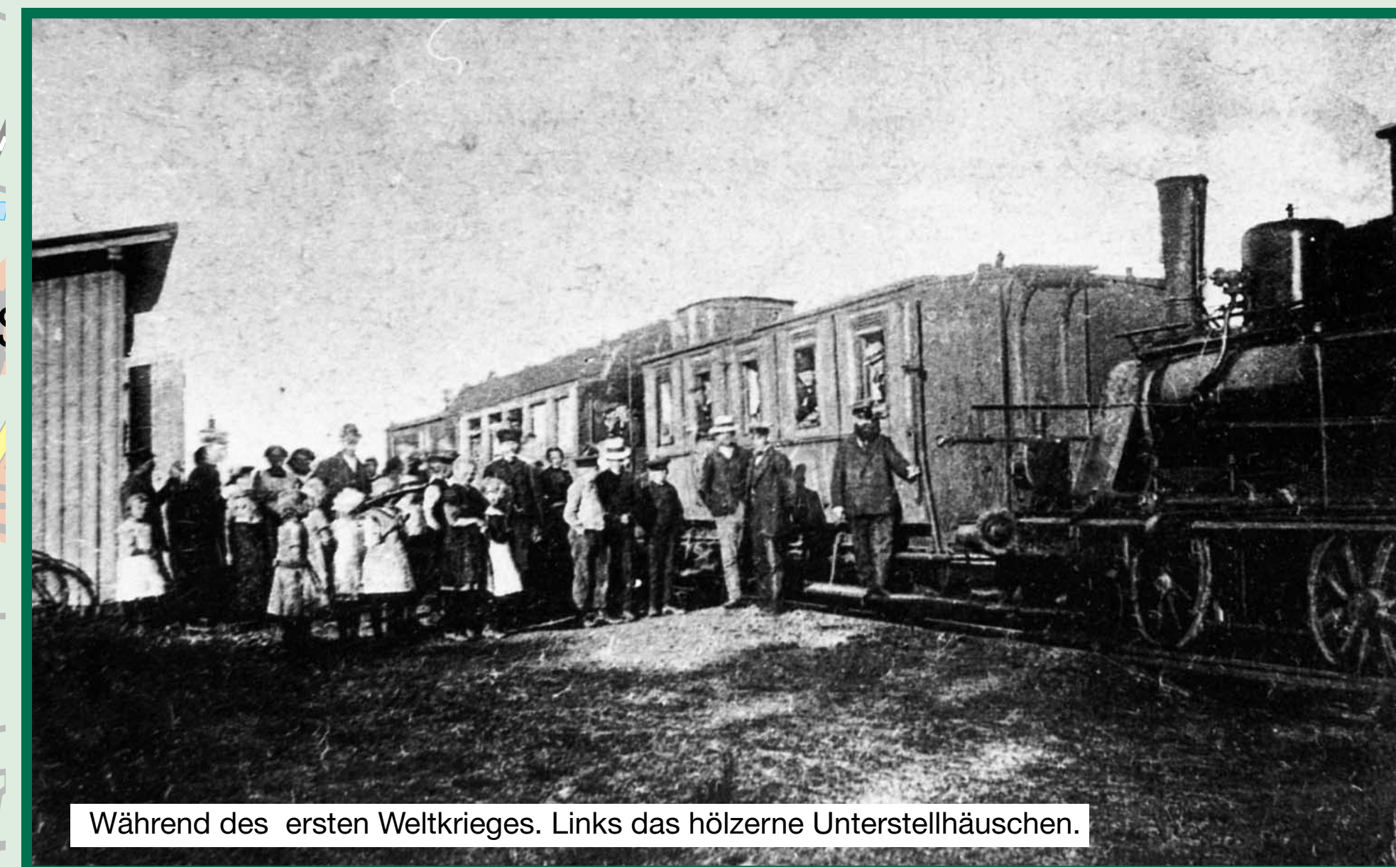
Während des ersten Weltkrieges. Links das hölzerne Unterstellhäuschen.