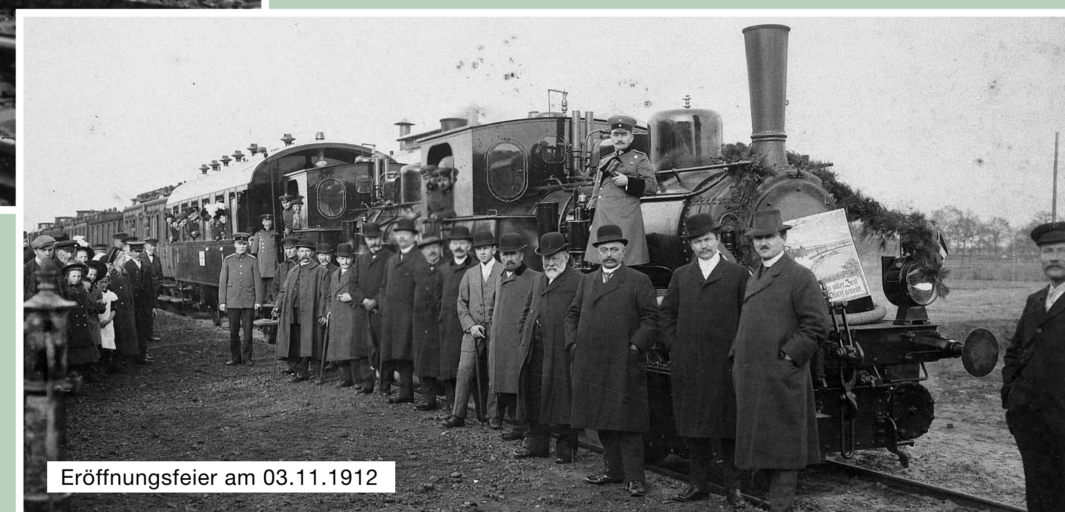
Eröffnungsfeier am 03.11.1912

Die Schienenstrecke von Westrhauderfehn bis zur Ladestraße in Ihrhove wurde 1975 abgebaut, das Reststück in Ihrhove 1979.