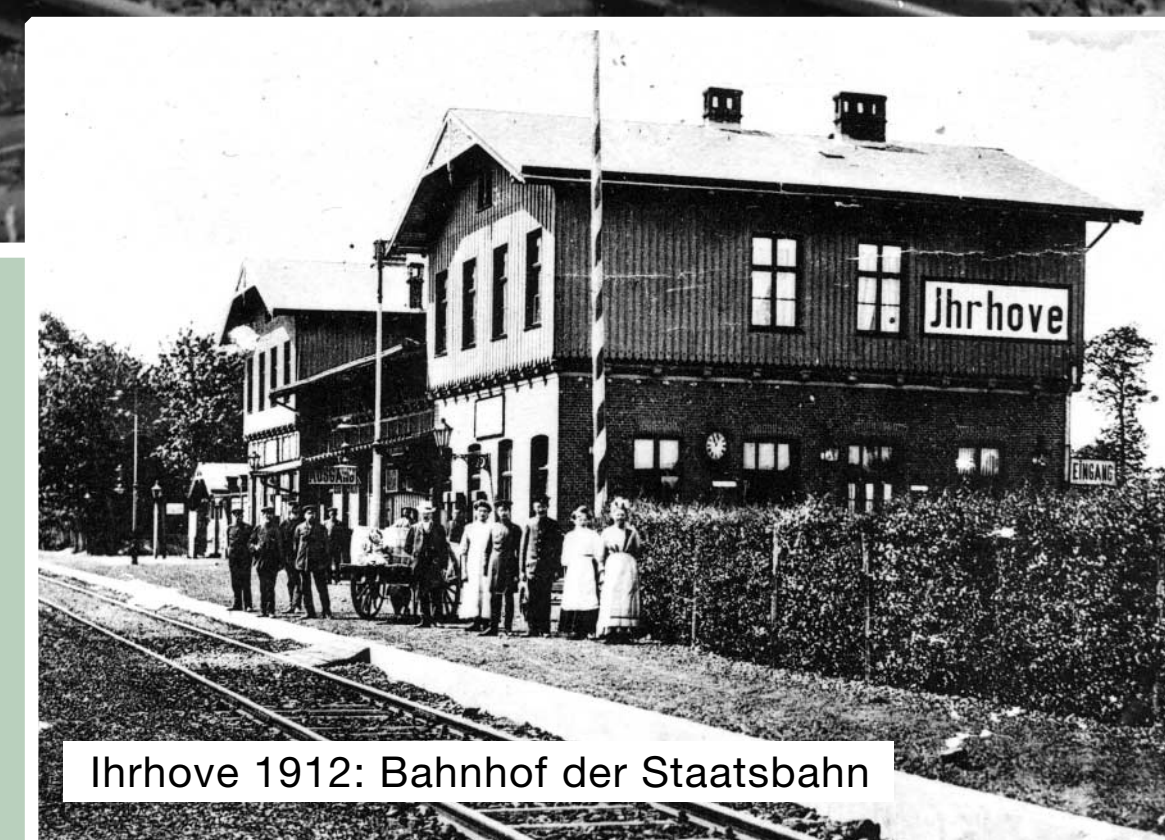
Ihrhove 1912: Bahnhof der Staatsbahn