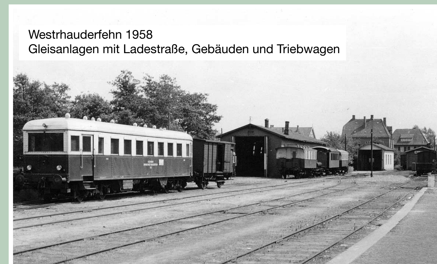
Westrhauderfehn 1958 Gleisanlagen mit Ladestraße, Gebäuden und Triebwagen