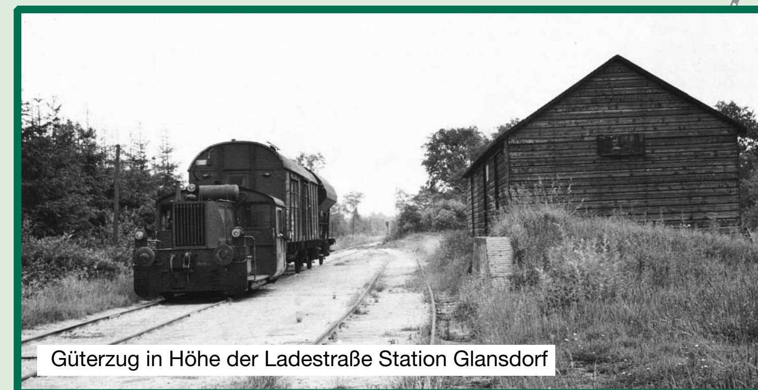
Güterzug in Höhe der Ladestraße Station Glansdorf

Eine Nachbesetzung erfolgte nach 1962 nicht, da die Haltestelle bedeutungslos geworden war. 1961/62 kamen monatl. nur rund 10 Stückgut- und Express-Sendungen und fast keine Wagenladungen mehr an.