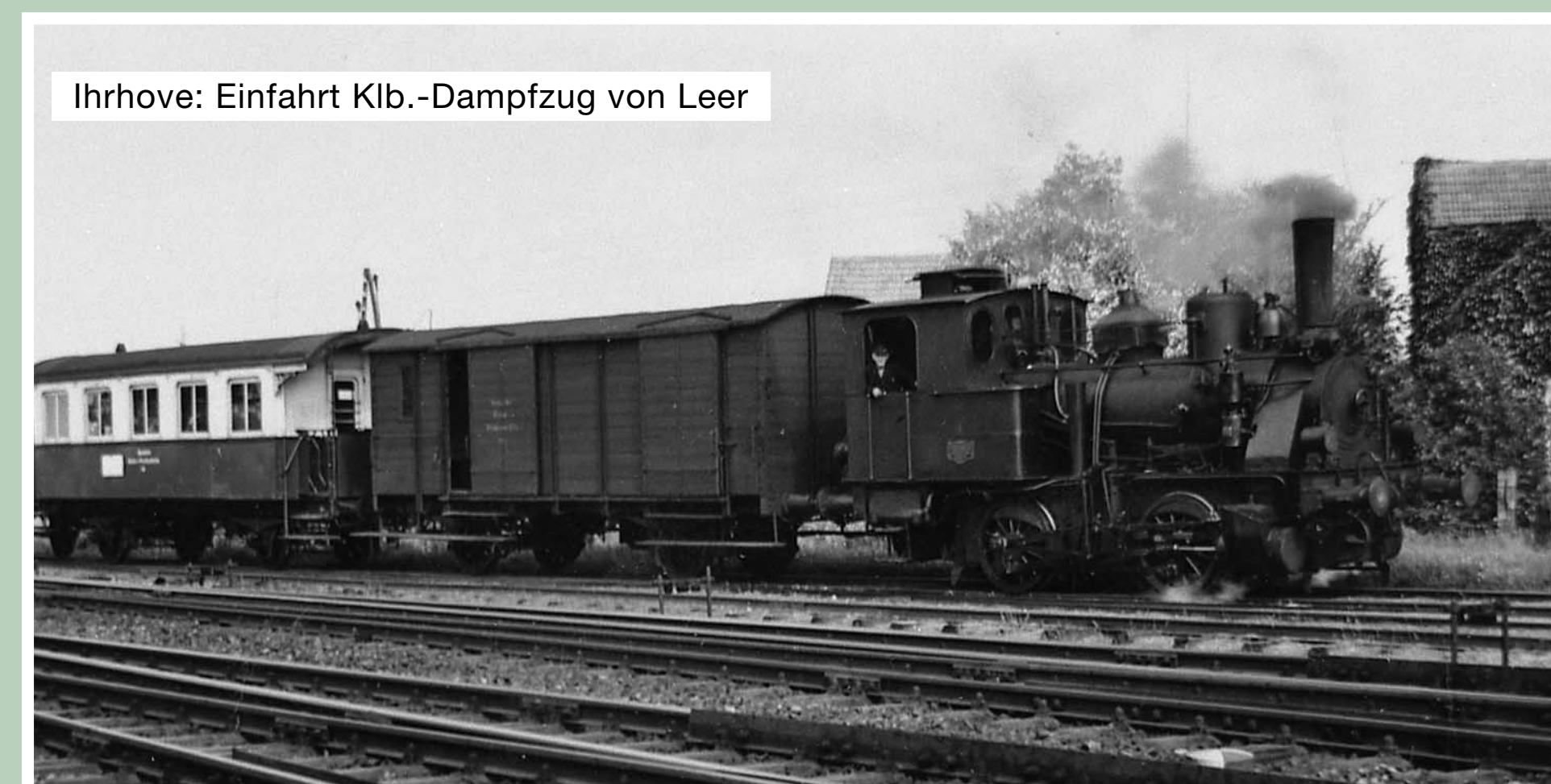
Ihrhove: Einfahrt Klb.-Dampfzug von Leer

Der Schienengüterverkehr wurde mit einer Diesellok bis Ende 1974 durchgeführt, nach Ihrhove-Ost noch bis 1979.