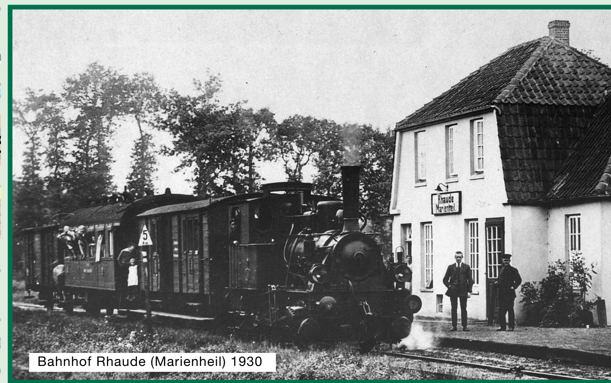
Bahnhof Rhaude (Marienheil) 1930