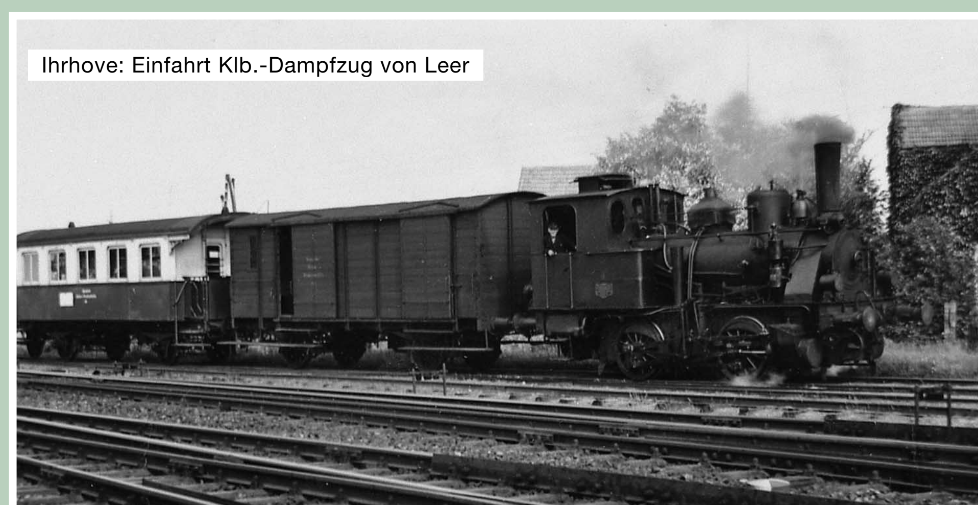
Ihrhove: Einfahrt Klb.-Dampfzug von Leer

Der Schienengüterverkehr wurde mit einer Diesellok bis Ende 1974 durchgeführt, nach Ihrhove-Ost noch bis 1979.