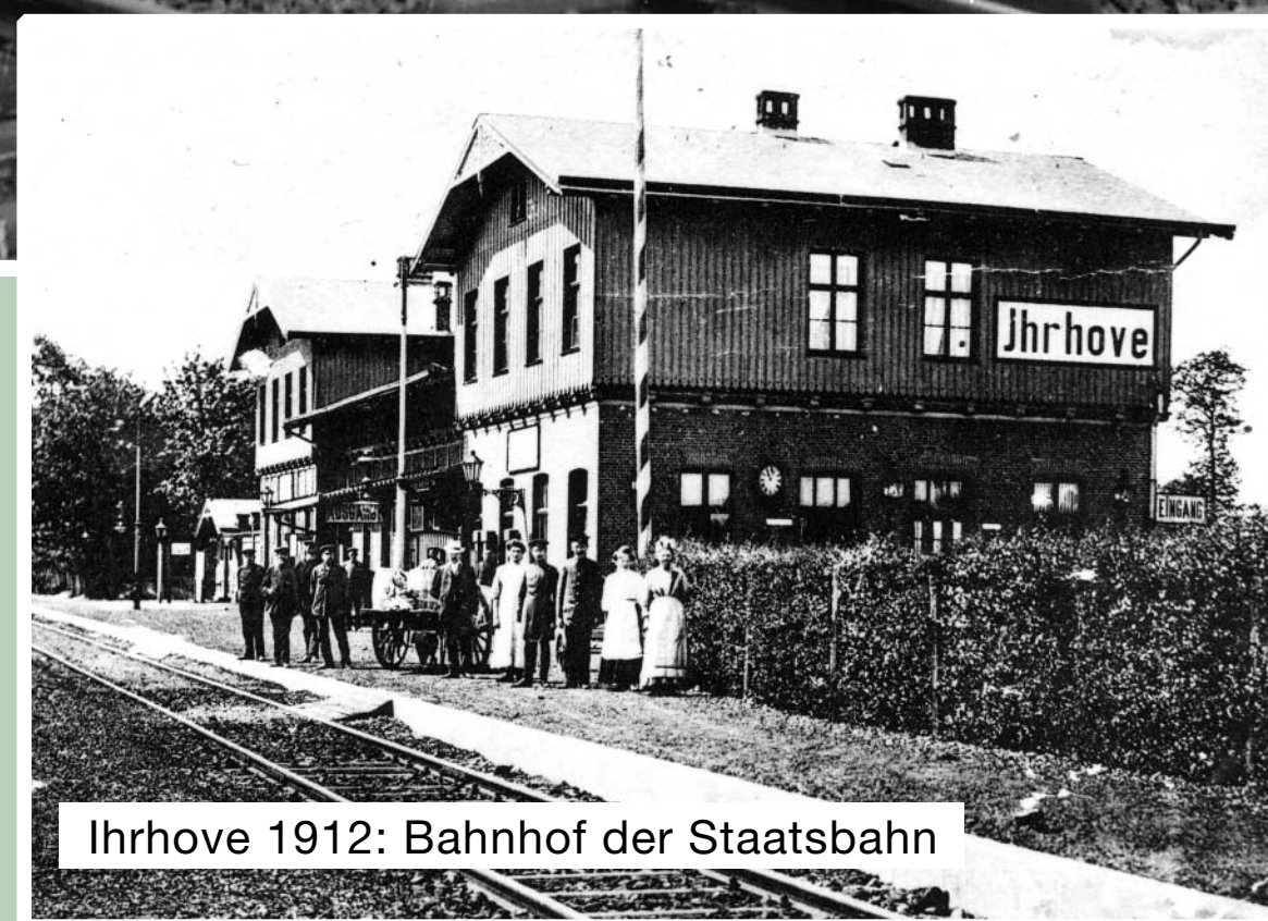
Ihrhove 1912: Bahnhof der Staatsbahn