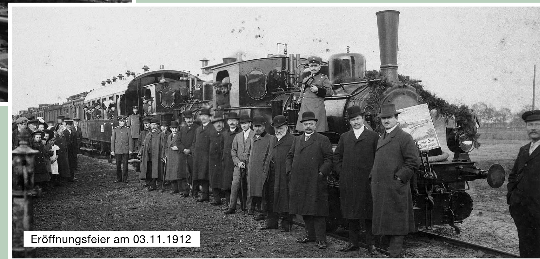
Eröffnungsfeier am 03.11.1912

Die Schienenstrecke von Westrhauderfehn bis zur Ladestraße in Ihrhove wurde 1975 abgebaut, das Reststück in Ihrhove 1979. Die Trasse wird seit 1979 als Ostfrieslandwanderweg von den Gemeinden Rhauderfehn und Westoverledingen unterhalten. Besonders von Radwanderer wird diese Strecke heute gerne genutzt.