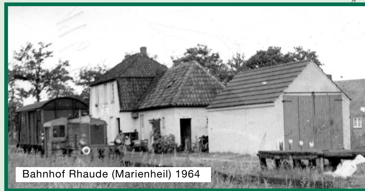
Bahnhof Rhaude (Marienheil) 1964

1926 erhielt der Bahnhof eine Wohnung für einen Bahnagenten und wurde seit der Zeit bis zur Einstellung des Schienenverkehrs von verschiedenen Bahnagentenfamilien bewohnt.